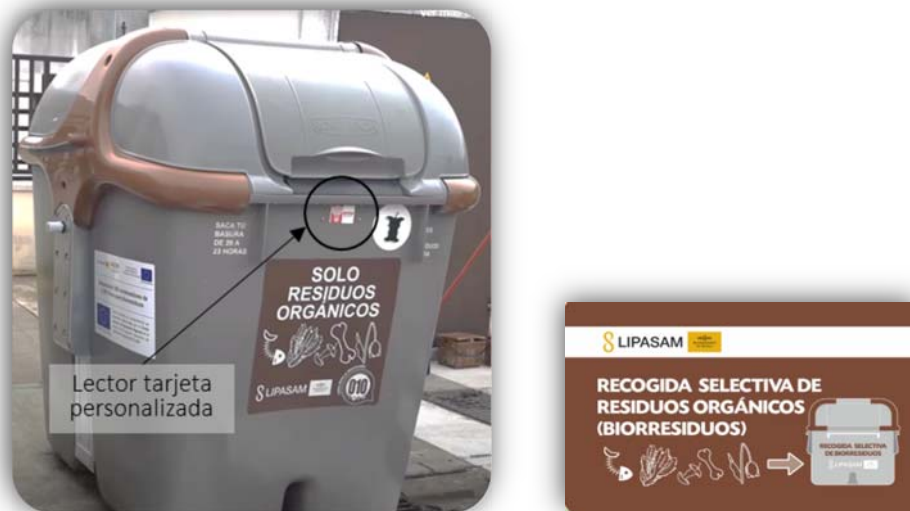
Figura 2. Contenedor de fracción orgánica con apertura electrónica personalizada (izquierda) y tarjeta electrónica personalizada para la apertura del contenedor (derecha).

Cada tarjeta está asociada a los datos del solicitante de forma que se garantiza su correcto uso. Estas tarjetas son gratuitas y se entregan en los puntos informativos de los barrios, en el 010, en Lipasam o en las sedes de los distritos.