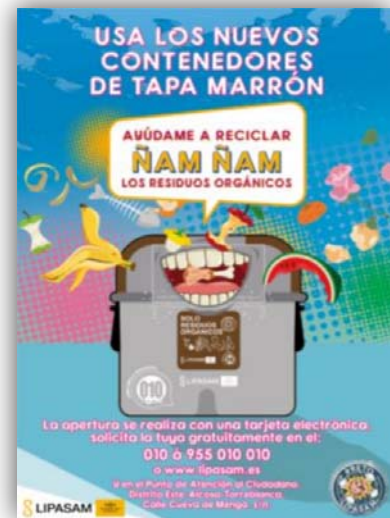
Figura 3. Ejemplos de campañas informativas de la recogida de la fracción orgánica: campaña realizada durante 2017 para informar sobre la recogida para grandes generadores (izquierda) y campaña desarrollada en diciembre de 2018 para informar sobre el nuevo sistema de apertura de los contenedores inteligentes (derecha).